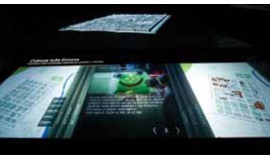
URŠA KARER

Nagrado Gubbio podeljuje združenje zgodovinskih in umetniških centrov (L'Associazione