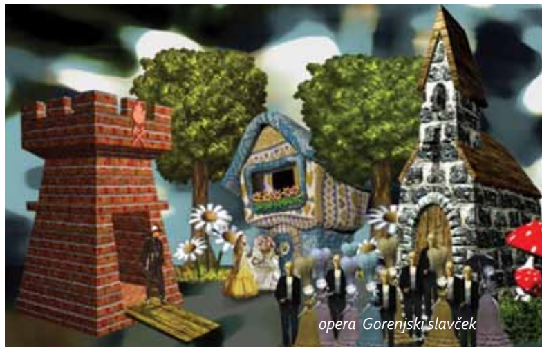
opera Gorenjski slavček