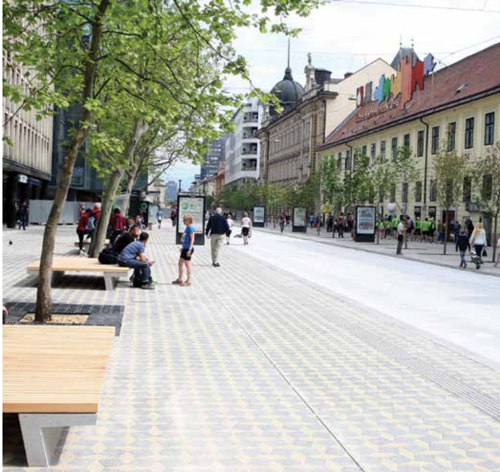
Na osrednjem delu Slovenske ceste je zasajenih 63 dreves vrste mali jesen.

Še bi lahko naštevala in opisovala zgodbe o prometni ureditvi, o tlaku in višinskih razlikah, o vodnem motivu in večnamenski skulpturi itd.,