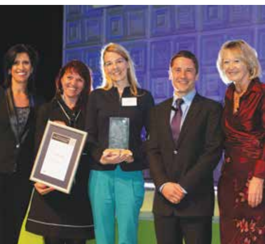
Prestizhno nagrado je delegacija MOL 15. aprila prevzela na slovesni razglasitvi v Madridu.

Ljubljana je dobitnica letošnjega izbora za nagrado WTTC »Turizem prihodnosti/ Tourism for Tomorrow« v kategoriji turističnih destinacij. Nagrada je Ljubljano v mednarodnih krogih dodatno pozicionirala kot izrazito zeleno, za življenje prijazno prestolnico.