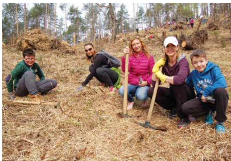
Še posebej veseli smo bili, da so se sajenja dreves lotile cele družine. (Sodelavke Energetike Ljubljana s podmladkom.)