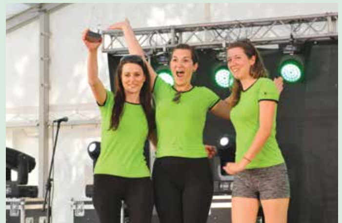
Uspelo nam je!