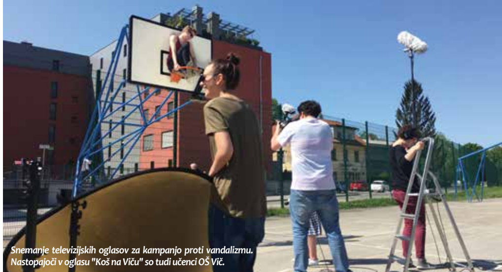
Snemanje televizijskih oglasov za kampanjo proti vandalizmu. Nastopajoči v oglasu "Koš na Viču" so tudi učenci OŠ Vič.

Mestna občina Ljubljana je pripravila kampanjo proti vandalizmu. V okviru kampanje, ki nosi slogan »Človek, čuvaj svoje mesto, samo eno imaš!« bodo izvedene številne aktivnosti.