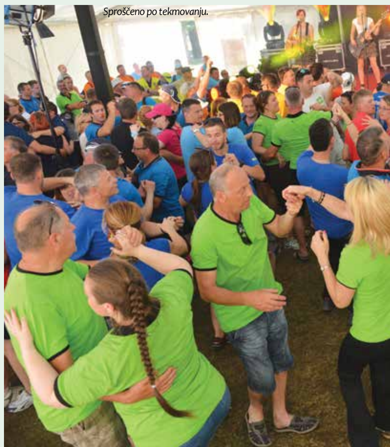
Sproščeno po tekmovanju.