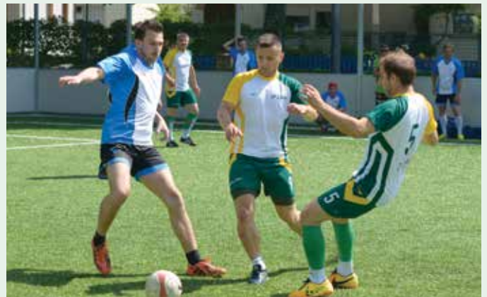
LPP, naš nogometni šampion!