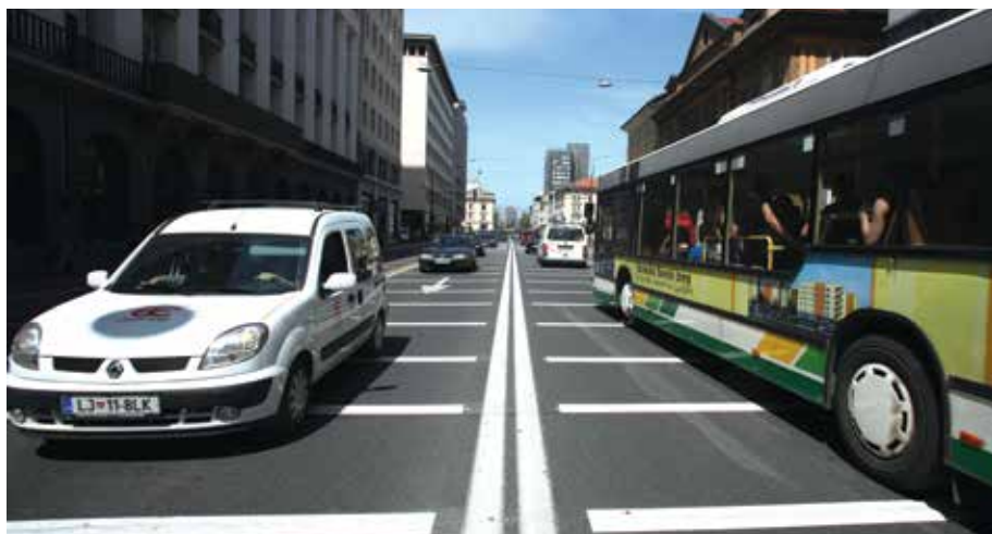
Kolona avtomobilov na Slovenski cesti; le še spomin na neke druge čase ...