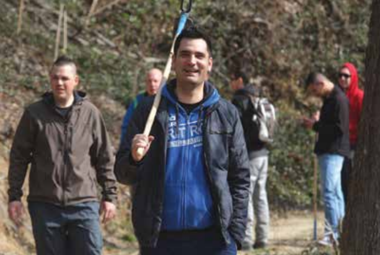
Gremo veselo na delo :)

Vsem, ki ste si vzeli čas in naredili ogromno delo za naše lepo mesto, se iskreno zahvaljujemo! Zaradi vseh vas, ki imate radi Ljubljano, lahko zdaj skupaj spremljamo rast naših dreves in uživamo v naši prelepi Zeleni prestolnici Evrope 2016!