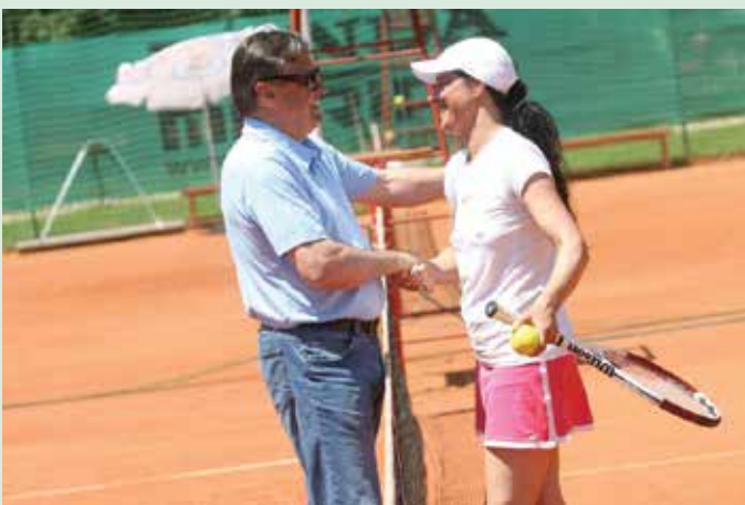
Sodelavka LPP-ja je v tenisu dosegla tretje mesto.