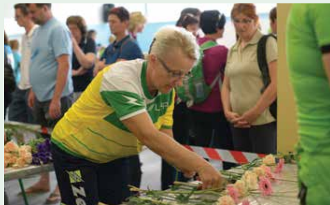
Pridne roke sodelavk in njihova ustvarjalnost so ustvarile čudovite šopke.