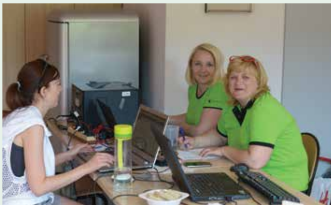
Brez odlične obdelave rezultatov ne gre!