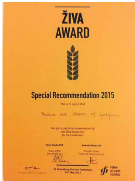
Dvanajst sodnikov iz enajstih držav je pri svojem delu ocenjevalo predvsem kreativnost, sporočnost, management, učinkovito rabo virov ter odprtost in privlačnost za obiskovalce.

Nagrado Živa za najboljši slovanski muzej je prejel Muzej Leo Tolstoj iz Rusija, nagrado