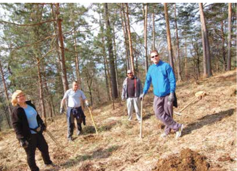
Smo dobro opravili?