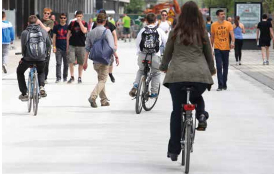
Prenovljeno Slovensko cesto so takoj za svojo vzeli kolesarji. Mimogrede, se še spomnite, kako neprijazna do kolesarjev je bila včasih?

Prenova Slovenske ceste je eden od tistih projektov, pri katerih so se ob ekipnem delu znova izkazali široko znanje in strokovnost sodelavk in sodelavcev velike mestne družine, njihova predanost skupnemu cilju, vztrajnost, trma in pa sklepanje kompromisov, ko je to potrebno. Hvala vsem, ki ste omogočili, da je nekoč glavna prometnica skozi mesto postala prijeten javni prostor s povsem novo identiteto, v kateri imajo glavno vlogo pešci in kolesarji! ●