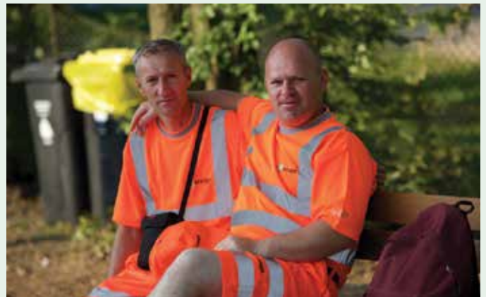
Zadovoljna sodelavca Snage.