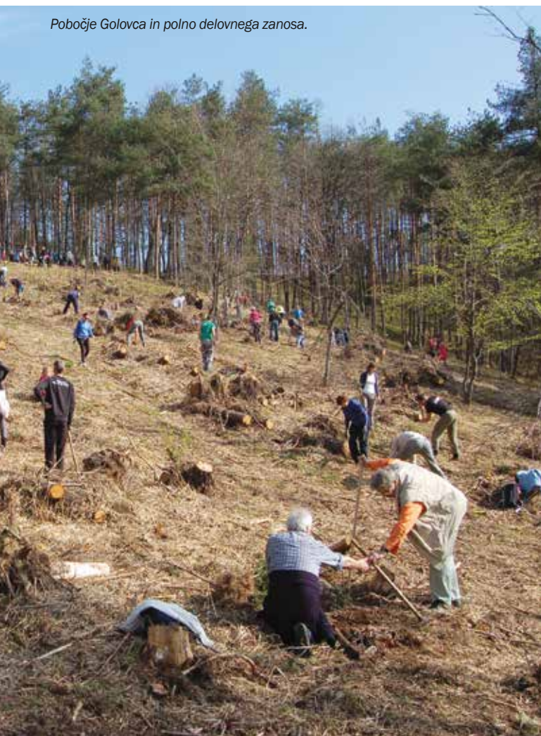
Pobočje Golovca in polno delovnega zanosa.