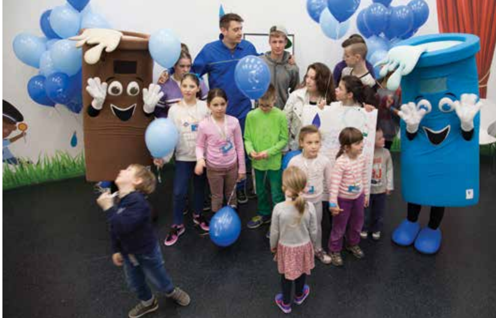
Otroci Mladinskega doma Malči Beličeve so v Hiši vode preživeli lepo in poučno nedeljo.

Ozaveščevalne dejavnosti v JP VO-KA spomladi še posebej oživijo. Delovanje sistemov oskrbe s pitno vodo in odvajanja ter čiščenja odpadne vode aktivno predstavljamo zainteresiranim skupinam otrok, dijakov, študentov in odraslih ter jim omogočimo tudi ogled objektov in naprav.