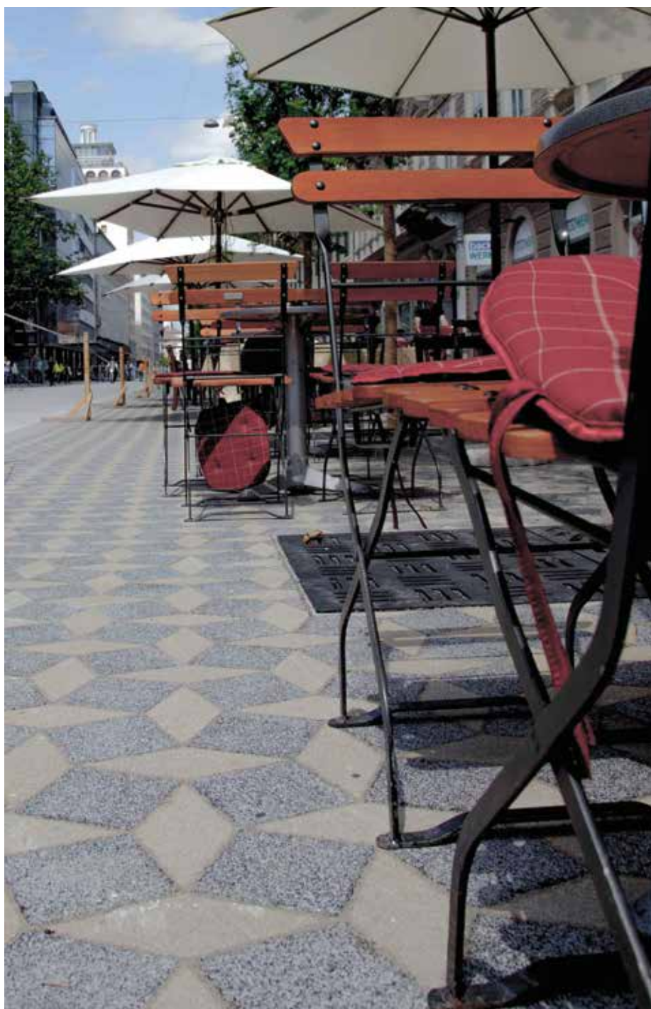
Avtomobile so zamenjale mizice in stoli.