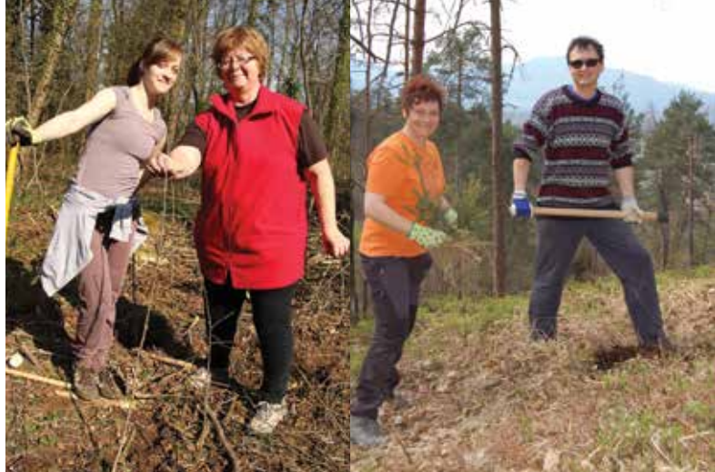
V slogi je moč, ali z drugimi besedami, v dvoje je še lepše. Levo sodelavki Mestne uprave MOL, desno sodelavca JHL.

Pisala se je sobota, 11. april 2015. To je bila prav posebna pomladna sobota in sonce je že zjutraj napovedovalo lep pomladni dan, kot nalašč za veliko delo – sajenje dreves na tistih območjih naše lepe Ljubljane, ki jih je lani tako grobo oklestil žled. Velika mestna družina je štrnila vrste in s skupnimi močmi smo na Golovcu, Sišenskem hribu in v Zajčji dobravi posadili več kot 4 tisoč dreves.