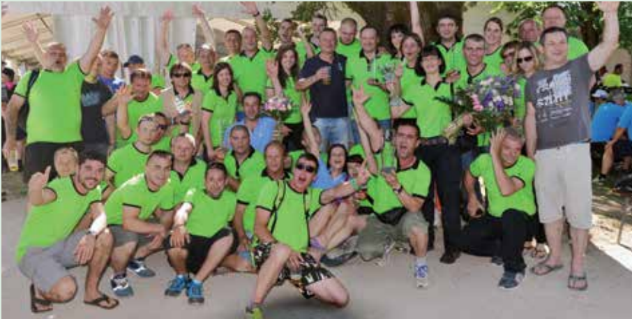
Veselje sodelavcev VO-KE po podelitvi pokalov.