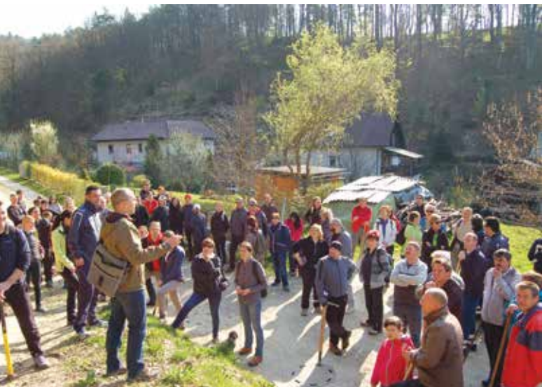
Najprej smo prisluhnili navodilom, nato pa pljunili v roke!