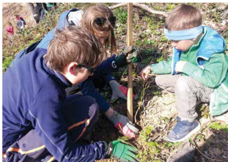
Mladi, ki spoštujejo okolje, so zagotovilo za zeleno Ljubljano tudi v prihodnje. (podmladek OPVI)