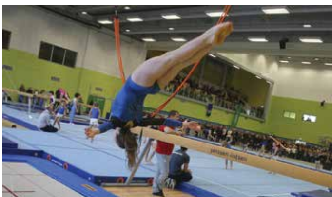
Nov, sodobni Gimnastični center Ljubljana nudi vrhunske pogoje za treninge.

Investicijski odhodki so v letu 2015 znašali 109 mio, investicijski transferi pa 19 mio evrov, kar prav gotovo kaže na izredno razvojno naravnost Mestne občine Ljubljana."