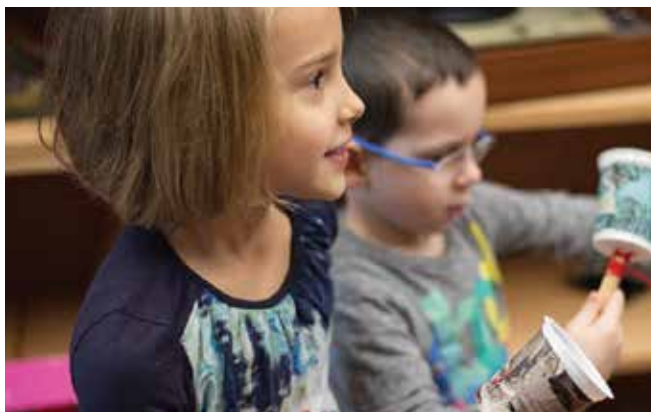
Javna podjetja tudi sicer veliko aktivnosti namenjajo otrokom. V info točki Ljubljana.Zate, za katero je v januarju skrbela Snaga, so se otroci iz vrtca igrali z igračami iz odpadnega materiala.