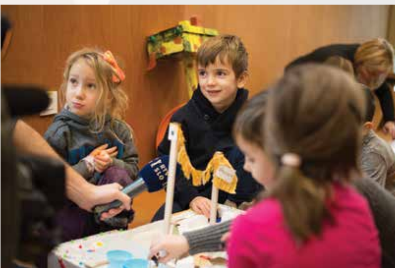
Otroci vsebine dobrih navad prenašajo na starše.