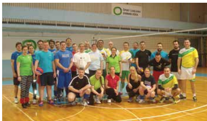
Ekipe so se zavzeto lotile svojega dela.

Šport je način druženja, krepitve povezanosti in motivacije. Sodelavci JHL in javnih podjetij smo izbrali odbojko in organizirali turnir, kjer smo se pomerili športni navdušenci Javnega holdinga Ljubljana, Snage in LPP. Na lepo januarsko sobotno popoldne je bilo v dvorani na Ježici vroče. V štirih urah so se zvrstile številne tekme, v katerih smo se tekmovalci borili kot levi. Najboljša je bila ekipa Snage, JHL-jevci pa smo v hudi konkurenci zelo dobrih ekip dosegli svojo prvo zmago, na kar smo izjemno ponosni.