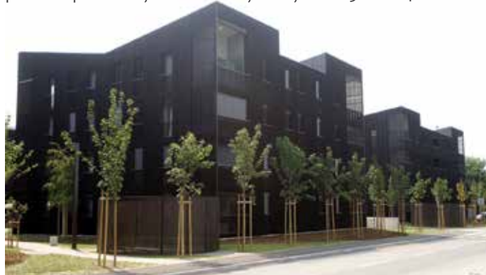
V lani odprti soseski Polje III je JSS MOL zagotovil 148 stanovanjskih enot.

Kljub angažiranosti JSS MOL in MOL pa izkazanega primanjkljaja v prestolnici ne bo mogoče odpraviti brez ustreznih ukrepov na državni ravni. Predvsem omejitev zadolževanja javnih skladov, ki je bila s spremembo Zakona o javnih skladih v letu 2008 znižana iz prej možnih 100 % na zgolj 10 % namenskega premoženja, onemogoča JSS MOL dodatno investicijsko aktivnost in pridobivanje večjega števila stanovanjskih enot. Vse to kljub dejstvu, da bi bistveno višji nivo zadolženosti lahko servisirali s pobranimi najemninami. Primanjkljaj je glede na število prosilcev na vsakokratnih razpisih za neprofitna najemna stanovanja ocenjen med 3.000 in 4.000 enot."