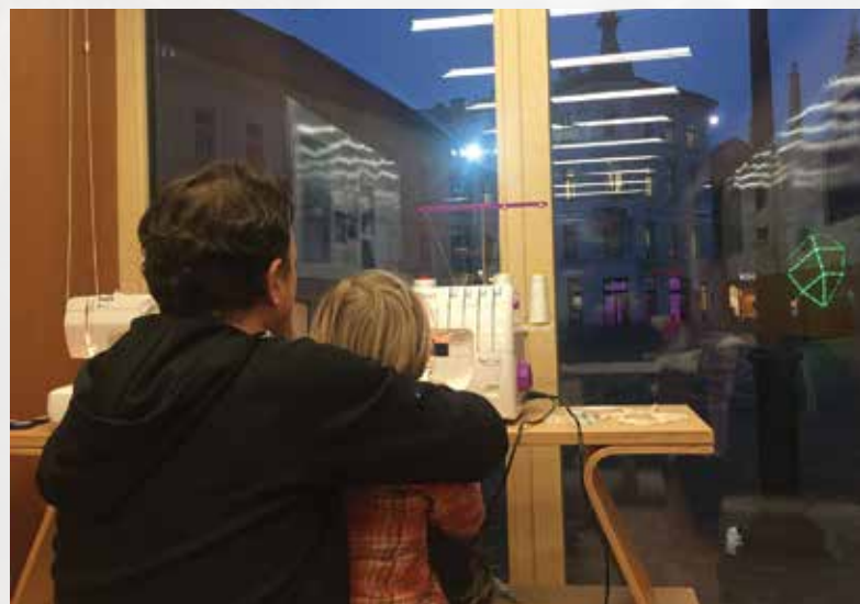
Šivanje vrečk za sadje iz starih zaves.

izmenjavo oblačil za odrasle, šivalnico vrečk za sadje in zelenjavo iz starih zaves, igralnico iz odsluženih materialov, delavnice za otroke, na katerih smo delali lovilce sanj, snežne kroglice, denarnice itd. Tem dvajsetim dogodkom smo dodali še petnajst dogodkov in aktivnosti na drugih lokacijah: v vrtcih in šolah smo se pogovarjali o tem, kam s stvarmi, ki jih ne potrebujemo več, v Črnučah smo pregledovali vsebino zabojnika, v Zieferblatu smo začeli z izmenjavo otroških oblačil, na ljubljanski tržnici smo spodbujali k uporabi vrečk, ki so boljša izbira od plastičnih.