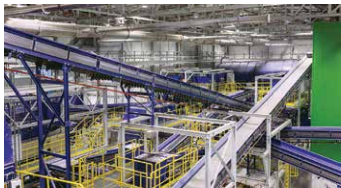
Po predelavi odpadkov v objektih RCERA na odlagališču konča manj kot 5 % odpadkov.

RCERO Ljubljana predeluje odpadke približno 1/3 Slovencev