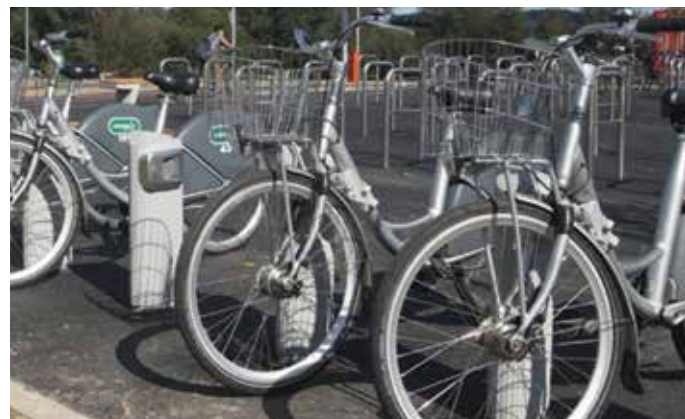
"Biciklji" so zelo popularni, zato načrtujemo širitev sistema izposoje koles.

Naša prizadevanja za izboljšanje kakovosti življenja v Ljubljani se z vsemi temi dosežki niso končala, temveč jih bomo še nadgrajevali."