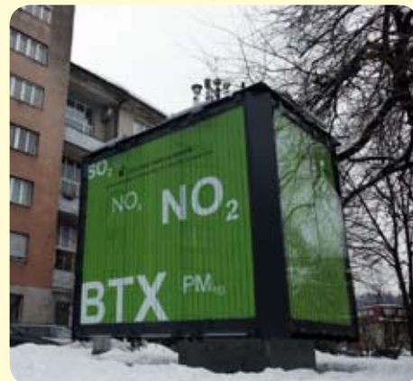
Nova podoba okoljskega merilnega sistema (OMS) na križišču Vošnjakove in Tivolske ceste.