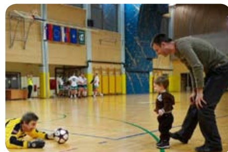
Na tekmi se je zabavala tudi najmlajša generacija.