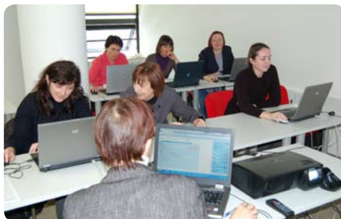
Delovna skupina za Kontroling.

in požrtvovalnega dela vseh udeležencev na projektu bo 1. maja 2010, ko je po terminskem načrtu predviden prehod v živo – poslovanje Javnega holdinga in javnih podjetij bo potekalo na poenotnem in standardiziranem aplikativnem okolju SAP.