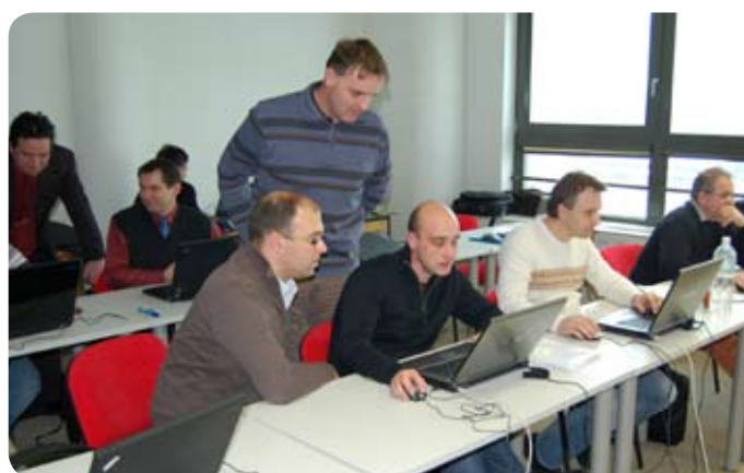
Delovna skupina za Vzdrževanje in Servis (delovni nalogi).