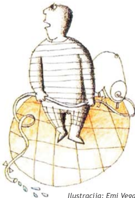
Ilustracija: Emi Vega

Verjetno vas je mnoge tale naslov presenetil in se sprašujete, ali ni marec mesec začetka koledarske pomladi in priprav na spomladansko čiščenje? Ja, res je. Ampak prav tako je to tudi najprimernejši čas, da premislimo, kako smo se ogrevali zadnjo zimo, in preverimo, ali smo porabili ravno dovolj za udobno ogrevanje ali pa nas je zeblo in nam je postalo vroče šele ob prejemu računa.