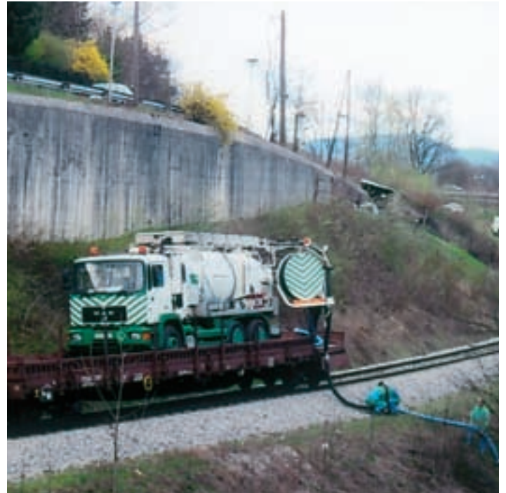
Kanal med Hradskega ceste in Grubarjevim prekopom je dostopen samo s pomočjo železniškega vagona.

Kdaj pa kdaj se tudi zgodi, da pridemo v kakšen objekt, med ljudi. Tako se je nekoč zaposleni, ki se mu ni ljubilo po kanalu nazaj, znašel v nakupovalnem središču. Pogledal je naokrog, pozdravil ljudi,