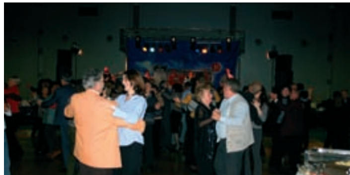
Rajali smo pozno v noč