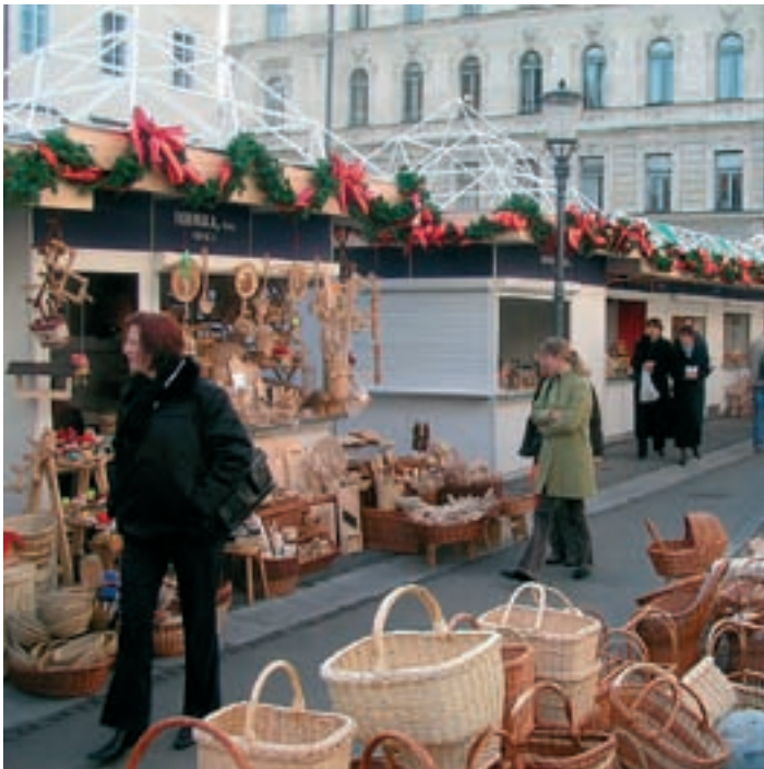
Pestra sejemska ponudba

program, med in medičarski izdelki in suho sadje. Prireditelj je popestrila tudi gostinska ponudba, kjer so bile poleg klasične ponudbe z žara na voljo tudi pizze in slastne palačinke.