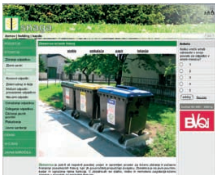
Tako je videti ena izmed novih spletnih strani JAVNEGA HOLDINGA Ljubljana in povezanih javnih podjetij.

v javnih podjetjih. Pozitivne spremembe bo prenova spletne predstavitev podjetij prinesla tudi uporabnikom, saj so nove spletne strani preglednejše, dodane pa so tudi vsebine, ki omogočajo hitro in enostavno komuniciranje uporabnikov storitev z javnimi podjetji.