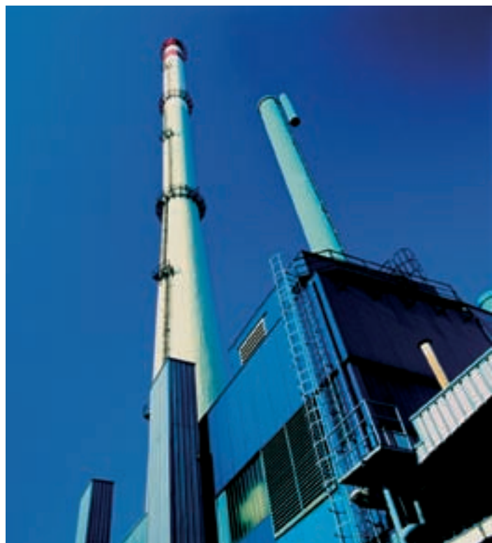
150 m visok dimnik Energetike Ljubljana je viden daleč naokoli.

Pripravljeni na spremembe Energetska oskrba in dejavnost družbe Energetika Ljubljana sta v službi javnega interesa občanov, vodstvo podjetja pa načrtuje in omogoča stabilen razvoj in perspektivno prihodnost podjetja in zaposlenih. V tem duhu so v JP Energetika že pripravljene na vse spremembe, ki se bodo pojavile po vstopu novih dobaviteljev na energetskega trg. Opti-