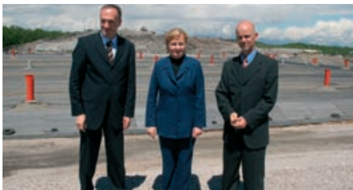
Minister, županja in začasni direktor Snage na odlagališču.

Zaposleni v Javnem podjetju Energetika so tudi letos lahko obogatili svoje znanje in izkušnje na strokovnem posvetovanju, ki ga je organiziralo Slovensko društvo za daljinsko energetiko in je bilo letos že osmo po vrsti. Od 30. marca do 1. aprila se je zvrstilo veliko predavanj na temo proizvodnje in distribucije v daljinski energetiki, na katerih so sodelovali s svojimi strokovnimi članki tudi strokovnjaki Energetike Ljubljana. Posvetovanje je obogatila bogata razstava energetske opreme. Energetika Ljubljana je sicer članica Gospodarskega združenja za plin, Evropskega združenja EUROHEAT & POWER, soustanoviteljica GROZD-a za daljinsko energetiko in članica Slovenskega društva za daljinsko energetiko. V prihodnjem letu že načrtujejo nadgradnjo povezovanja teorije in prakse, posvetovanja v obliki delavnic, ki se bodo navezovala na strokovno področje delovanja (finance, strojništvo, trženje in drugo).