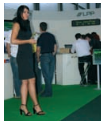
Hostese so dobro promovirale tehnološke rešitve.