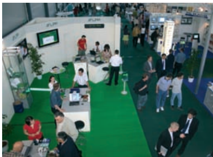
Razstavní prostor JP LPP na Hevrekí.