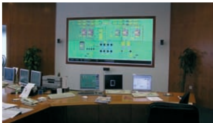
Stenski prikazovalnik v Centru za vodenje.

Javno podjetje Energetika je na področju daljinske oskrbe s toploto posodobilo svojo dejavnost z namestitvijo stenskega prikazovalnika v Centru za vodenje. Investicija je bila potrebna predvsem s stališča kakovostnega vsebinskega pregleda nad obratovanjem, analiziranjem in optimiziranjem delovanja sistemov, saj bo z novim stenskim prikazovalnikom pregled bistveno bolj transparenten. Projekt vgradnje, parametriranja in integracije prikazovalnika v obstoječi sistem JPE ne pomeni samo združevanja obstoječih aplikacij na enem mestu, temveč tudi kakovostni preskok s stališča nadzora sistemov in izboljšanja kakovosti podatkov iz procesov.