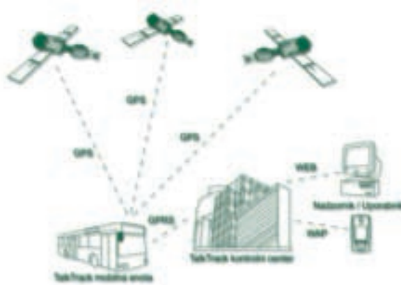
Grafični prikaz delovanja sistema TalkTrack.

centrom in vozilom. S tipko SOS, ki se nahaja na terminalu, je poskrbljeno tudi za večjo varnost voznikov. Voznik s pritiskom tipke SOS sproži alarm, ki se vidi v nadzornem centru. Poleg alarma se v nadzorni center prenese tudi informacija o lokaciji vozila v danem trenutku.