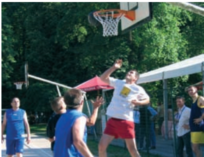
Športno in veselo vzdušje na srečanju.