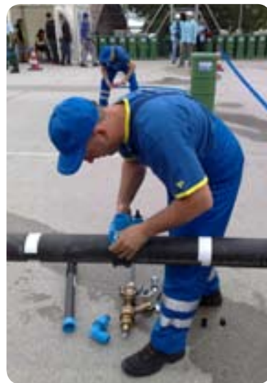
Ekipa JP Vodovod Kanalizacija so svoje vsakodnevne izkušnje uporabile in osvojile odlična mesta.

Vsem udeležencem čestitamo in se veselimo ponovnega snidenja naslednje leto.