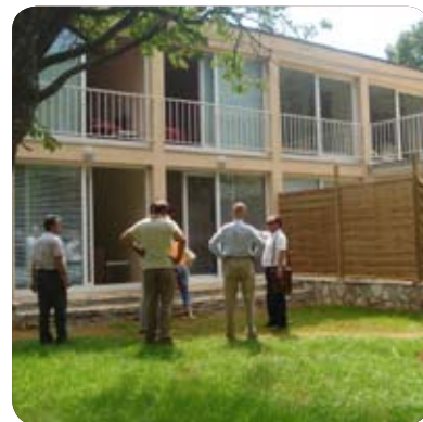
Prenovljen počitniški dom Snage

Udeleženci piknika, bilo jih je približno tristo, so uživali v sproščenem druženju ob dobri hrani in pijači ter se pomerili v različnih športnih aktivnostih – potekali sta namreč tekmovanji v odbojki na mivki in v pikadu. Tisti, ki jim je pri srcu ples, so se z veseljem zavrteli v različnih ritmičnih ob glasbi zakoncev Barle. Veselega in sproščenega vzdušja ni manjkalo, z veliko dobre volje pa je k temu prispeval tudi župan s podžupanjo, podžupani in direktorjem mestne uprave.