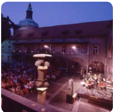
Še zadnji dogodki Festivala Ljubljana

Tudi letošnje poletje je Festival Ljubljana 2007 poskrbel za živahen kulturni utrip v mestu, saj se je v njegovem okviru zvrstilo več kot sedemdeset prireditev, na katerih je nastopilo prek tri tisoč umetnikov iz 23 držav. Poleg osrednjega poletnega festivala, ki je potekal med 2. julijem in 1. septembrom, so festivalsko sezono popestrile še filmske uspešnice, ki si jih je bilo mogoče ogledati v čudovitem ambientu pod zvezdnim nebom na Ljubljanskem gradu, X. mednarodna likovna kolonija, ki je gostila mnoge izvrstne in priznane umetnike, med njimi tudi svetovno znanega slikarja Manuela Chabrero, ves čas festivala pa so v razstavnih prostorih Ljubljanskega gradu potekale tudi številne razstave, od katerih bodo nekatere na ogled še vse do konca oktobra.