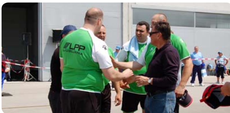
Vsak uspešen nastop terja dobro strategijo. »Bojni« posvet pred tekmovanjem je bil zato nujen in fantje so se ga lotili resno.