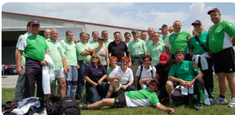
Našim ekipam na Komunaljadi dobre volje nikoli ne zmanjka, saj se zavedajo, da je pomembno sodelovati, če je še kakšen dober rezultat zraven, pa tudi ne škodi.