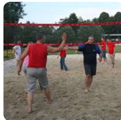
Prijetno druženje v Podpeči

Na Prazniku suhe robe so domači mojstri radovednežem predstavili pletenje košar, izdelavo zobotrebcev, grabelj ter drugih izdelkov iz lesa. Predstavili so se krošnjarji, obiskovalce je razvedril harmonikar, bogat pa je bil tudi zabavni program v sodelovanju z radiom Veseljak. Prireditve se je dobro prijela, zato bo postala tradicionalna in bo na vrsti vsako leto tretjo soboto v mesecu juniju.