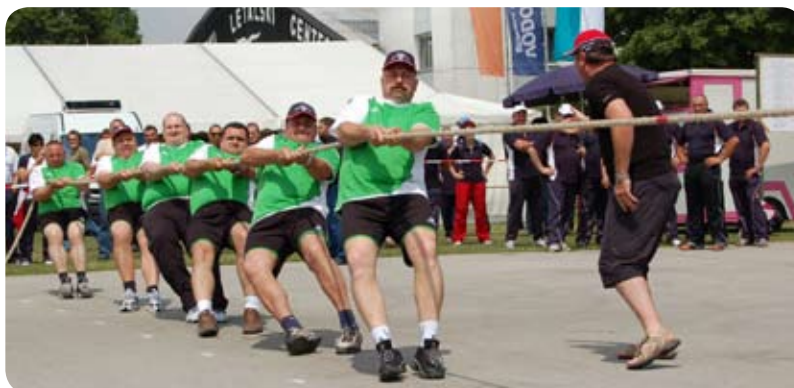
Fantje iz LPP, ki običajno vrtijo volan in pritiskajo na stopalke, so se tokrat z nogami uprli v tla in ob spodbudi vodje ekipe dosegli odlično 2. mesto.