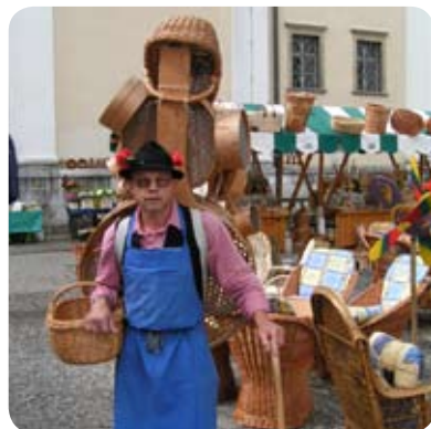
Zabavno in poučno

Več informacij o prireditvah lahko najdete na spletni strani www.ljubljanafestival.si .