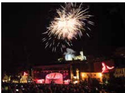
Otvoritev 65. Ljubljana Festivala

Priznana katalonska gledališka skupina La Fura dels Baus se vrača v Ljubljano, na 66. Ljubljana Festival. Eden od šestih umetniških vodij, Carlus Padrissa, ki je lani otvoril 65. Ljubljana Festival s scensko kantato Carmina Burana, se s svojo novo umetniško stvaritvijo poklanja Magellanovi odpravi iz leta 1519. Predstava Sfera Mundi – Potovanje okrog sveta, ki bo narejena posebej za prizorišče na Kongresnem trgu, pripoveduje zgodbo o prvi plovi okrog sveta, s katero so dokazali, da je Zemlja okrogla. Nastala je v koprodukciji s Festivalom Ljubljana in jo bodo po svetovni premieri na Kongresnem trgu 28. junija uprizarjali še nekaj let. Posvečena je tudi stoletnici opere in baleta Narodnega gledališča v Ljubljani, saj bodo z Orkestrom Slovenske filharmonije pod taktirko Josepa Vicenta nastopili ljubljanski baletniki.