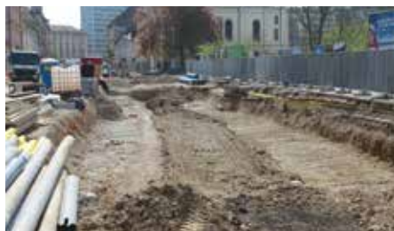
Kmalu bodo končana tudi dela na Gosposvetski cesti, katere videz bo po prenovi sledil videzu Slovenske ceste. Tudi tu bo odslej več prostora namenjenega pešcem in kolesarjem.