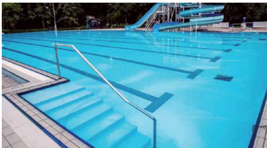
Osvežite se v bazenih kopališča Kodeljevo.

Konec junija se bo začela tudi poletna sezona na kopališču Kodeljevo , kjer se boste lahko osvežili v dveh plavalnih in enem otroškem bazenu ter na vodnem toboganu. Kopališče je ob vročih dneh toliko bolj vabljivo, ker ima na voljo veliko travnate površine z naravno senco.