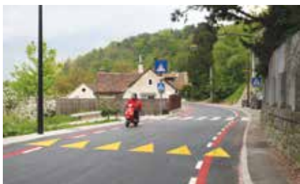
Na Hradskega ulici je zdaj na obeh straneh urejen kolesarski pas, na eni strani pa tudi pločnik (pred Litjijsko cesto je pločnik urejen na obeh straneh).