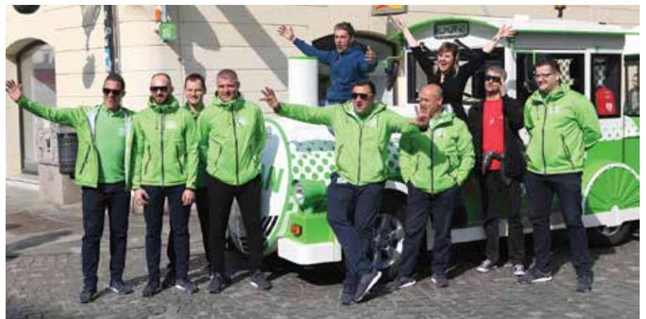
Osem voznikov je usposobljenih za vožnjo električnega vlakca. Na svoj prvi dan je vlakec potnike razvjal brezplačno, po trasi je poln zapeljal kar 8-krat, po opravljenih vožnjah pa je ostalo še 30 % baterije. Ekipa radia Antena je 4 ure jutranjega programa oddajala v živo iz vlakca.

Starejši nemški par v prvem vagonu vlakca je navdušen nad zvočnim vodstvom, ki je potnikom na voljo v 9 jezikih, navdušen nad lepoto izbranih besed, izgovorjavo, poetičnostjo, predvsem pa simboliko, ki se skriva za skrbno izbranimi besedami vodenja v nemškem jeziku. Informacij in podatkov med vožnjo je ravno prav, da ostane čas za občutenje mesta, razmislek o videnem, rav-