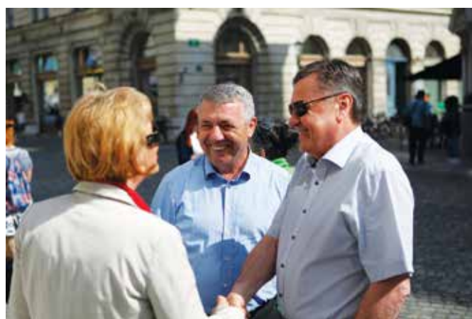
Župan je projekt »vlakec Urban« ves čas podpiral. Na otvoritveni vožnji je pozdravil sodelavce, predstavnike medijev ter meščanke in meščane, ki so prišli na brezplačno vožnjo.