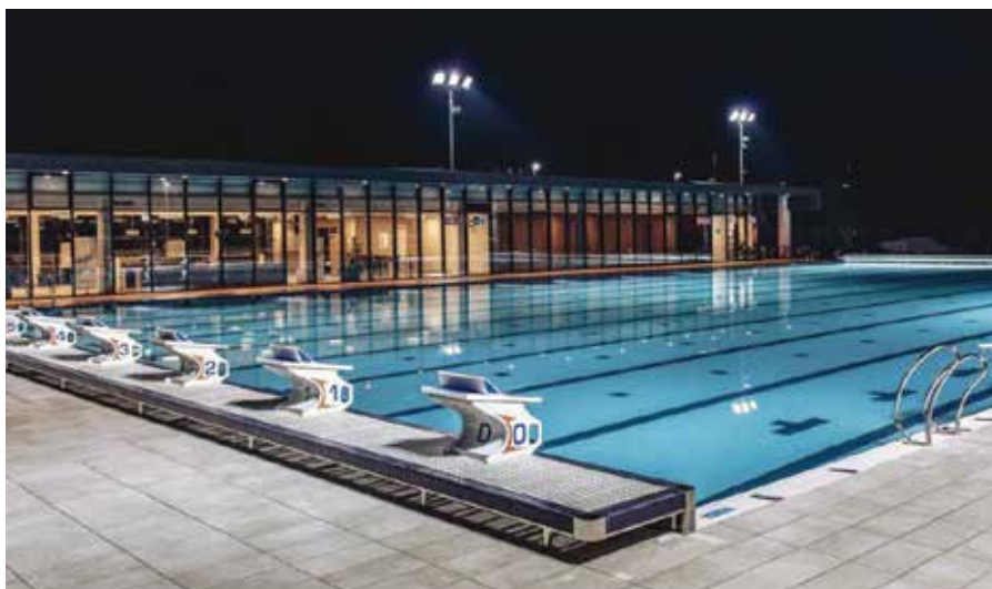
Idilična podoba Kolezije.

Sredi maja je svoja vrata odprlo kopališče Kolezija . Čudovit moderen objekt, ki smo ga odprli leta 2015, nudi aktivnosti tako za rekreativne plavalce in tekmovalce kot tudi za turiste. Obiskovalci se lahko razvajajo v velikem olimpijskem bazenu, malem otroškem bazenu z masažnim delom in čofotalnikom, igrajo namizni tenis, košarko in odbojko na mivki. V vročih poletnih dneh še posebej prav pride tudi možnost parkiranja v parkirni hiši.