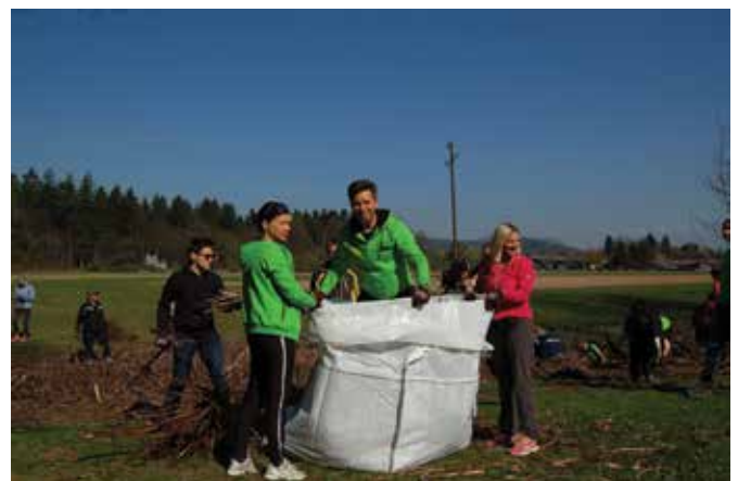
Vreče, napolnjene s suhim japonskim dresnikom je treba potlačiti in napraviti prostor.