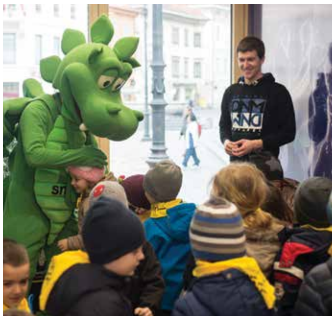
Sodelavci snage so svoja prizadevanja za boljšo družbo na Točki.Zate predstavili tudi najmlajšim.

Snaga je v lanskem letu največ energije usmerila v Regijski center za ravnanje z odpadki (RCERO) Ljubljana. Z zagonom objektov za mehansko in biološko obdelavo odpadkov so razširili dejavnost in pridobili nova zelena delovna mesta ter zagotovili obdelavo odpadkov za 50 slovenskih občin. RCERO Ljubljana ima velik pomen tudi za prehod na širšo usmeritev Snage – prehod v krožno gospodarstvo, v katerem je pomembno, da različni viri v proizvodnem in potrošniškem ciklu ostanejo čim dlje. RCERO obnavlja naravne vire, udejnjanja ponovno uporabo, optimizira in zapira krožno gospodarstvo.