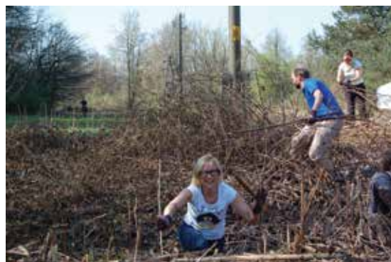
Bivanju dajemo utrip - tudi s takimi akcijami.