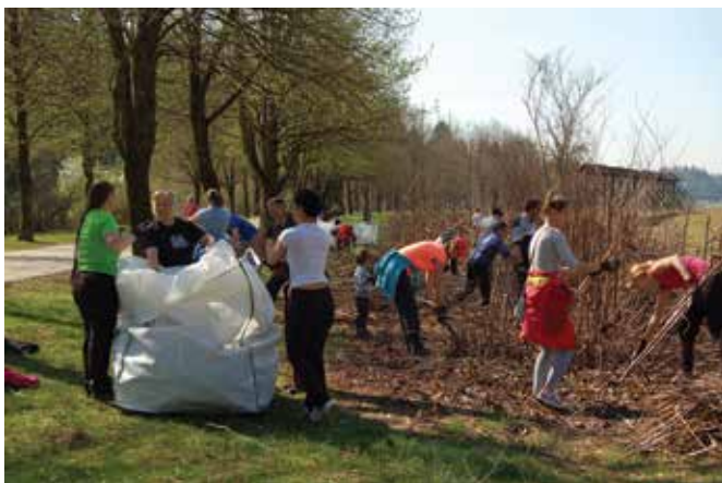
S sodelovanjem ustvarjamo Ljubljano.