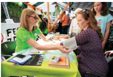
Na Festivalu zdravja so organizirane brezplačne preventivne meritve.

Lekarna Ljubljana vabi na 4. Festival zdravja. Namen festivala je ozaveščanje o pomembnosti preventivnih aktivnosti za ohranjanje zdravja in dobrega počutja. Vstopnine na dogodek ni.