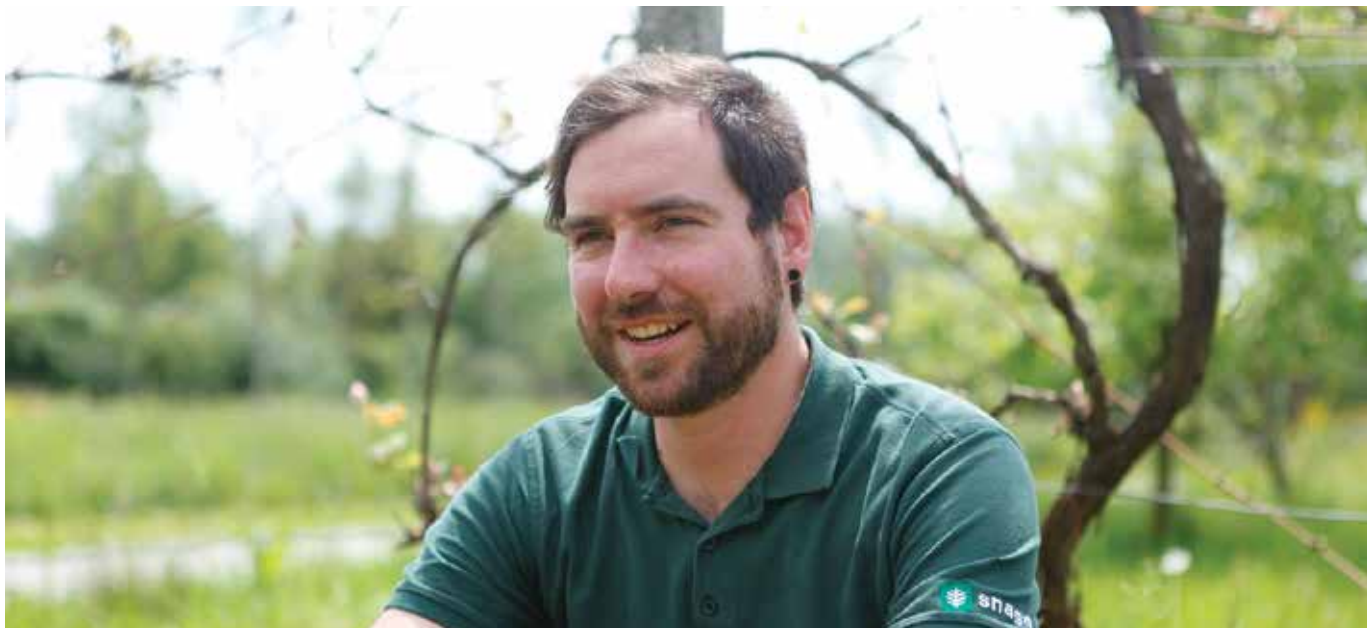
Moj najljubši kotiček v Ljubljani je Mestni park Rakova Jelša.