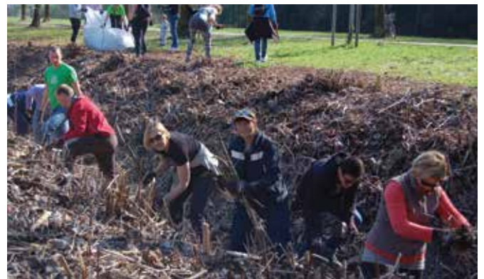
Sodelavci JP LPT-ja v prvih bojnih vrstah.

Tiste sončne sobote, prvega aprila, smo čistili območje vodotoka Pržanec, ob Poti spominov in tovarištva.