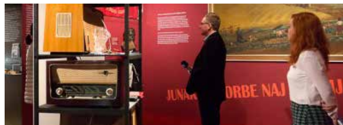
Nova doba prihaja! Samo v Mestnem muzeju Ljubljana do 3. septembra.

Po dveh svetovnih vojnah, nekaj gospodarskih krizah ter revoluciji, v času socializma in planskega gospodarstva, je nastopila zlata doba industrije. Povojne socialistične tovarne pa niso bile le proizvodni obrati. Podjetja so v duhu kolektivizma svojim delavcem organizirala tudi njihova življenja. Izobraževanje, rekreacija, zdravstvo, posojila, kulturne vsebine, razvedrilo, sindikalna počitnikovanja in štipendiranja v takratni novi dobi so višali kakovost delavskega življenja.