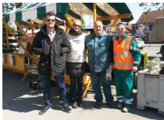
V slogi je moč - terenska ekipa Oddelka za varstvo okolja in Snage.