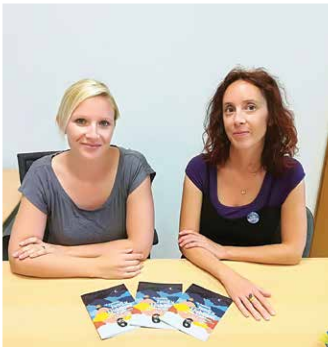
Teja in Nina dihata s festivalom Junij v Ljubljani in vas vabita na Kongresni trg: Foto: arhiv MOL Oddelek za kulturo