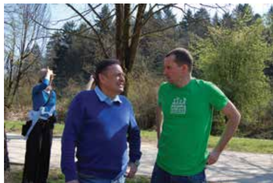
Župan je pohvalil trud sodelavcev za zeleno Ljubljano.