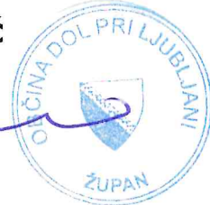
Željko SAVIČ Član