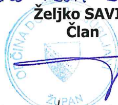
Željko SAVIČ Član