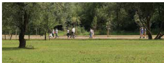
Park Rakova Jelša, ena izmed novejših zelenih oaz Ljubljane.

Na nekoč prav tako degradiranem območju na južnem delu Ljubljane smo uredili park Rakova Jelša , s katerim smo povezali mesto s Krajskim parkom Ljubljansko barje. To območje so dolga leta obremenjevali gradbeni in azbestni odpadki. Očistili smo ga, uredili in ozelelili. Postalo je priljubljeno mesto za druženja in preživljanje prostega časa. Del parka je namenjen pristočasnim dejavnostim, na drugem delu pa so urejeni vrtički in javni sadovnjak.