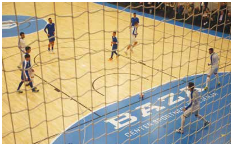
Center športnega življenja Baza, prostor za rekreativni in vrhunski šport.

Dvorano so kmalu po odprtju preizkusili tudi že vrhunski športniki, saj so tu potekali treningi reprezentanc, ki so nastopale na evropskem prvenstvu v futsalu.