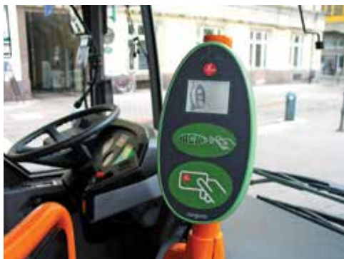
Zapis nakupa mesečne vozovnice preko spletne aplikacije Urbana On-line se bo na kartico Urbana (ali IJPP) prenese ob prvem dotiku kartice na validatorju v avtobusih.

Kartico Urbana danes za vožnje z avtobusi uporablja že 550.000 uporabnikov, ugodnosti spletne aplikacije Urbana On-line pa se poslužuje že preko 60.000 uporabnikov. Do zdaj so uporabniki na aplikaciji lahko spremljali stanja in pregled zgodovine transakcij na kartici Urbana.