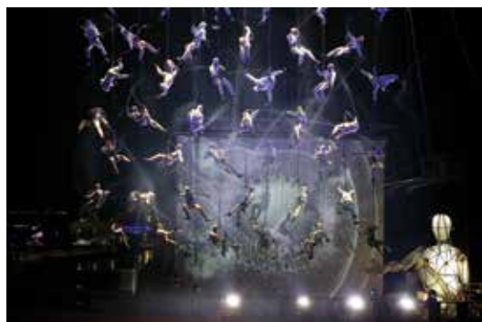
La Fura dels Baus.

Pomlad bodo v Ljubljani zaznamovali že 33. Slovenski glasbeni dnevi. Med 12. in 19. aprilom bodo zazvenele številne krstne izvedbe. Prva izvedba Osterčeve »Iz komične opere« po kar 90-letih, obeležili bomo štiristoletnico izida instrumentalne zbirke plesnih suit Isaaca Poscha, proslavili 100 let od ustanovitve opere in baleta in se s slavnostno otvoritvijo spominske plošče poklonili češkemu dirigentu Václavu Talichu.