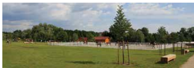
VRIC Sava je veliko prostora namenjenega tudi ljubiteljem jahanja.

Lep primer je Rekreacijski in izobraževalni center Sava , ki se razteza od Tomačevega do Sneberij in obsega kar 144.618 m 2 . Nove urejene in zelene površine na območju, ki so ga nekoč kazile črne gradnje, zdaj ponujajo idiličen prostor za sprostitev, rekreacijo, izobraževanje in aktivni oddih.