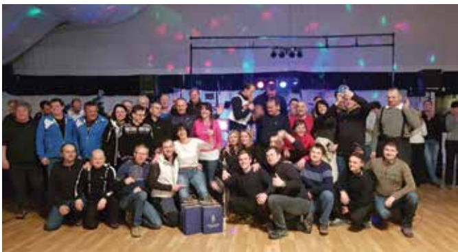
Zadovoljna in razigrana ekipa JP VO-KA po osvojenem 1. mestu v skupinski razvrstitvi.

Prijetnega zimskega srečanja delavcev komunalnega gospodarstva so se poleg sodelavcev JP Vodovod-Kanalizacija udeležili tudi sodelavci Ljubljanskega potniškega prometa ter JP Ljubljanska parkirišča in tržnice. Vsi skupaj so bili s svojo vrhunsko pripravljenostjo in nalezljivo ter nepremagljivo dobro voljo težka konkurenca ostalim udeležencem.