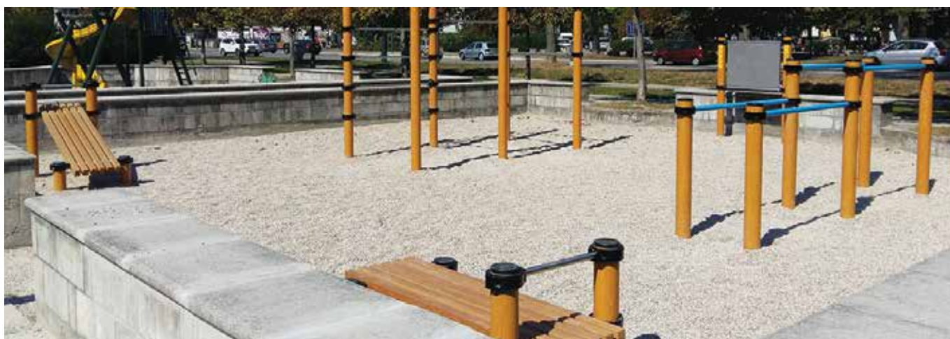
Naprave za ulično vadbo najdete na vseh koncih Ljubljane. Na njih lahko vsak vadi po svojih močeh in željah.

V Ljubljani se lahko razgibate na 22 zunanjih fitnes napravah, 4 trim stezah, pri 8 trim otokih in na 13 napravah za ulično vadbo. Lokacije najdete na Ljubljana.si, v rubriki Šport v Ljubljani.