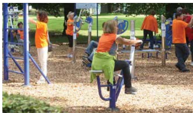
Fitnesi na prostem so zelo priljubljeni tudi med starejšimi, ki tako skrbijo za svoje zdravje.

Ali ste vedeli: delež Ljubljančanov, ki so vsaj enkrat tedensko športno aktivni, presega 67 % in je nad slovenskim in evropskim povprečjem. Ste med njimi tudi vi?