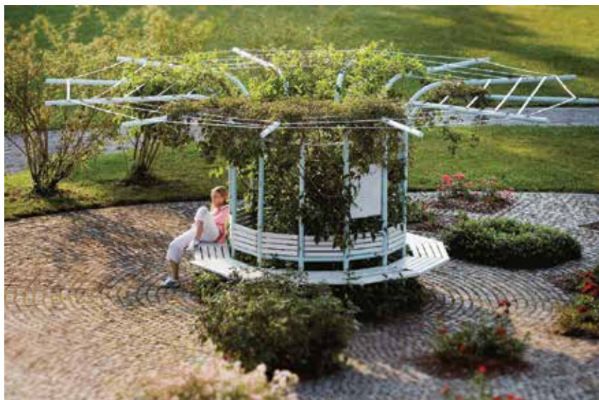
Park Tivoli.

Mestna občina Ljubljana je Snagi podelila koncesijo za upravljanje krajinskega parka Tivoli, Rožnik in Šišenski hrib. Prejem koncesije je potrditev zaupanja za do zdaj opravljeno delo Snage na področju upravljanja zelenih površin. Hkrati za Snago predstavlja velik strokovni izziv, kako nadgraditi dejavnost, da bo za meščane življenja še kakovostnejše.