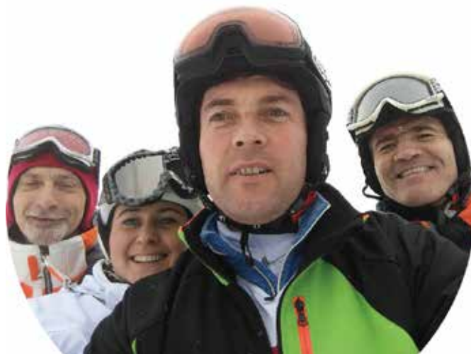
Sodelavka in sodelavci LPP odlično pripravljeni in razpoloženi pred startom.

Tekmovalci JP Ljubljanska parkirišča in tržnice so se domov vrnili z dvema pokaloma, in sicer za 1. mesto v veleslalomu za ženske in 3. mesto v veleslalomu moški, v katerem so dosegli tudi nehvaležno 4. mesto.