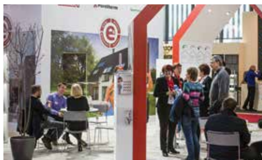
57. mednarodni sejem Dom bo na Gospodarskem razstavišču potekal od 12. do 18. marca 2018. Več informacij najdete na www.sejemdom.si.

Novosti in zadnje trende razstavljalcev s področij gradbeništva in stavbnega pohištva, ogrevalne in hladilne tehnike, notranje opreme, varovanja in urejanja okolice dopolnjuje vse sejemske dni brezplačno svetovanje strokovnjakov Gradbenega inštituta ZRMK, Eko sklada in ENSVET za vse tiste, ki prenavljate, gradite ali pa to načrtujete. V osredju sta trajnostna gradnja in ter celovita energetska prenova stavb.