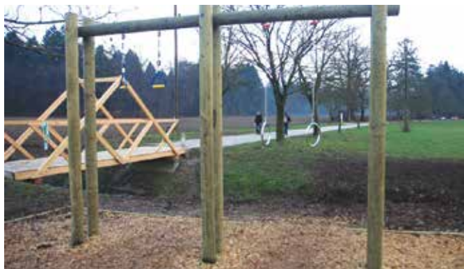
Otok športa ob Poti spominov in tovarištva.

Med zelo priljubljene točke za rekreacijo sodijo otoki športa , ki so postavljeni v vseh ljubljanskih četrtnih skupnostih. Sestavljajo jih zunanje fitnes naprave , trim otoki , trim steze ter naprave za ulično vadbo . Na otokih športa poteka tudi brezplačna organizirana vadba , s katero vsem generacijam, od otrok do starejših, izboljšujemo možnosti aktivnega preživljanja prostega časa v naravi. Trajanje vadbe je 45 minut. Lokacije in urniki so objavljeni na FB in spletni strani Šport Ljubljana.