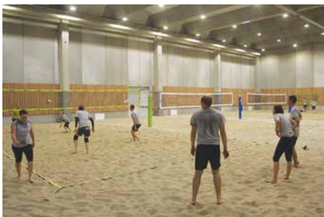
Če je odbojka na mivki poletni šport, potem je v dvorani Ludus celo leto poletje!

Javni zavod Šport Ljubljana upravlja in vzdržuje kar 97 športnih objektov na različnih lokacijah po Ljubljani, v katerih nudijo številne možnosti za rekreacijo in šport, njihovo ponudbo pa dopolnjujejo še objekti, izvedeni v okviru javno-zasebnih partnerstev. Med temi to-krat omenjamo le zadnji dve pridobitvi – športni dvorani Ludus in Baza .