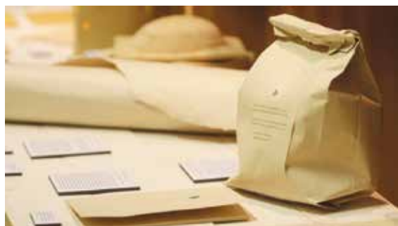
Med razširjenimi invazivnimi rastlinami pri nas je tudi japonski dresnik, iz katerega smo že izdelali papirne izdelke.

Ocenjena vrednost projekta je 5.202.590 evrov (gre za upravičene stroške), od tega sofinanciranje s strani EU znaša 4.162.072 evrov.