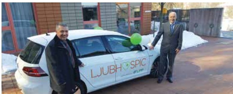
Direktor Ljubhospica je od LPP simbolno prevzel električno vozilo.